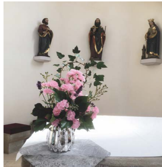
Blumenschmuck, Jakobuskirche Nagelsberg

Mi. 17.06., 14.30 Uhr, Seniorenachmittag