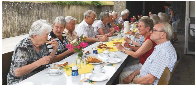
Seniorenachmittag im Sommer 2025